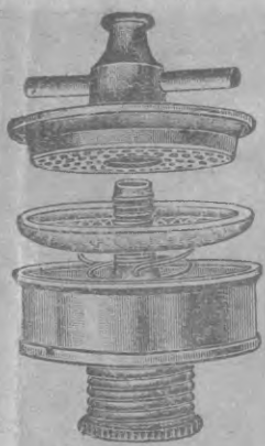
MOUNTAIN SPRING FILTERS

IS PURE WHOLESOME AND CRYSTALLINE WHEN DRAWN THROUGH